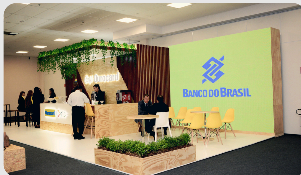
Ativação Banco do Brasil e Ourocard