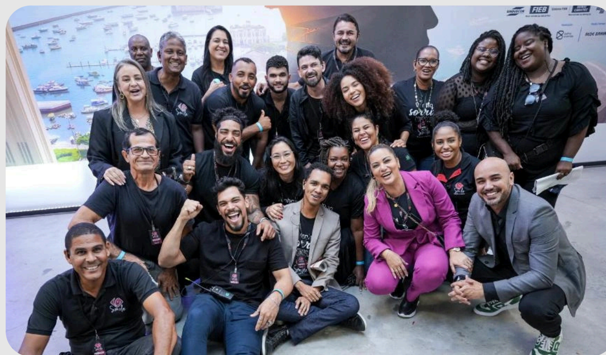
Equipe na ConstruNordeste