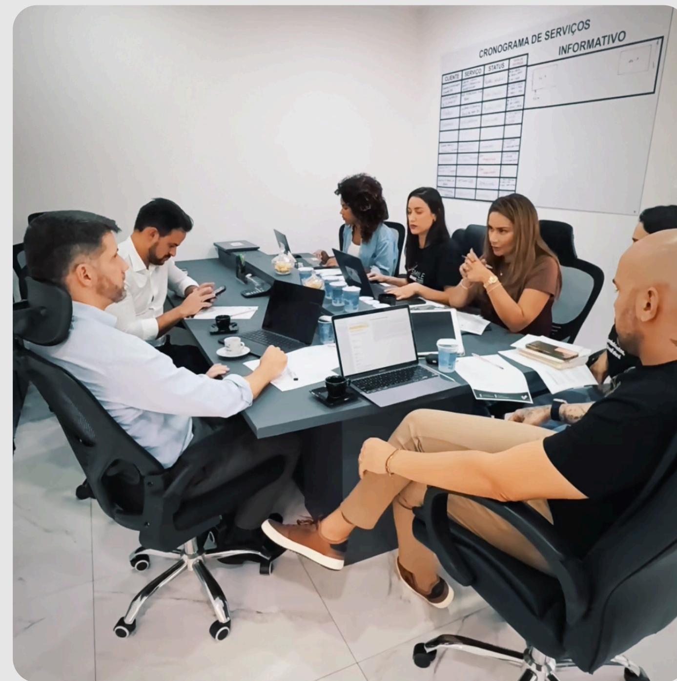
Reunião estratégica da SSA RUN LIFE