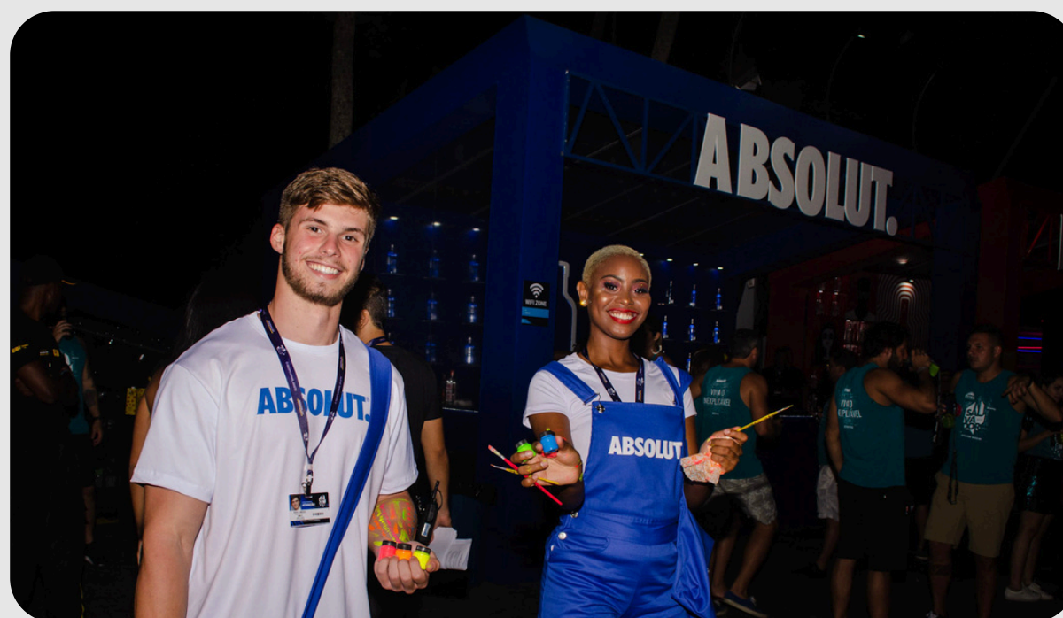
Ativação Absolut, Carnaval Camarote Salvador