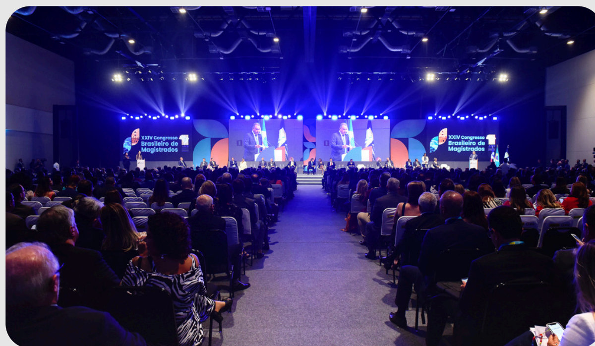
XXIV Congresso Brasileiro de Magistrado